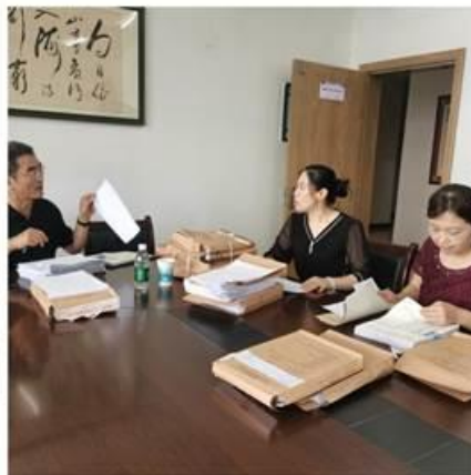
督导专家分组深入教学单位检查教学档案材料